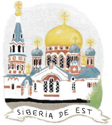
SIBERIA DE EST