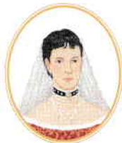
ÎMPĂRĂTEASA MARIA FEODOROVNA (1847-1928)