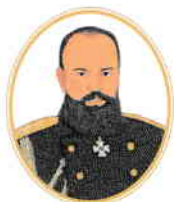
ÎMPĂRATUL ALEXANDRU AL III-LEA (1845-1894)

P e când era copil, viitorul Împărat Nicolae Romanov, la fel ca frații și surorile sale, se îmbrăca în straie simple, făcea sport și, lucru surprinzător pentru un moștenitor la tron, dormea pe un pat tare, din scânduri. Fiii și fiicele Țarului Alexandru, tatăl lui Nicolae, nu erau răsfățați cu dulciuri și delicate-se. Dimpotrivă, educația pe care o primeau îi pregătea pentru a